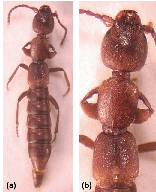
FIGURA 1. Domene (s. str.) gevia sp. nov.: (a) Habitus; (b) Detalle de la cabeza, pronoto y élitros.

Patas relativamente largas y de aspecto robusto.